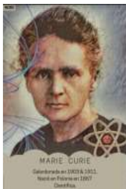
(A) 22 cartas