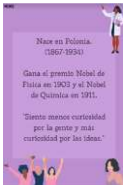
(B) 22 cartas