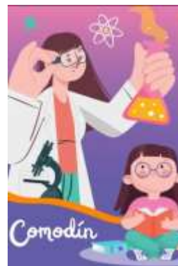
(D) 4 cartas